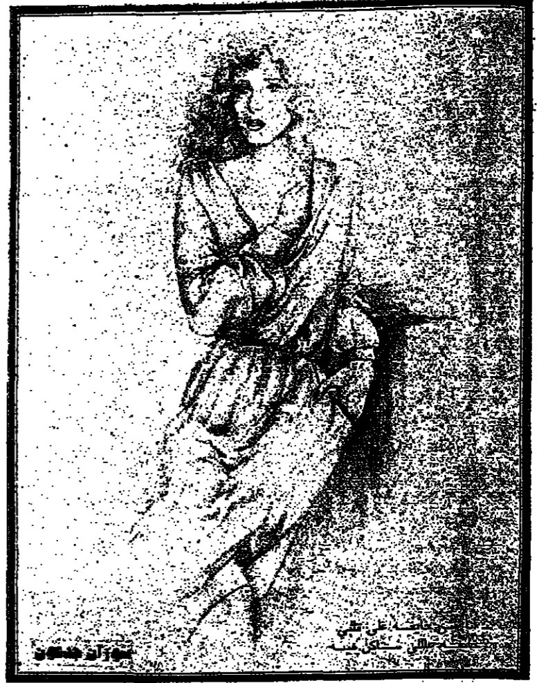
مع السخني الصغير: